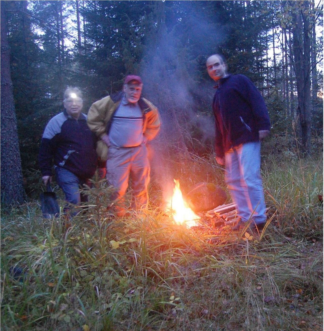
Kuva 5 Iltanuotio metsässä on hienoa. Lokakuussa ei hyttysenkään hätistelleet.

Iltakahvit keitimme pakilla pihanuotiossa. Yöllä ei metsän keskellä näkynyt mutta kuin nuotio loimu. Ilman oli lämmin, noin 5 astetta, yhtään hyttystä tai karpästä ei ollut häiritsemässä iltanuotio tunnelmaa.