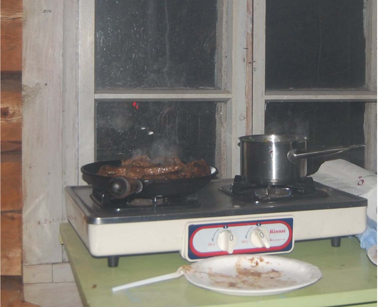
Kuva 4 Illan hämärtyessä siirryimme sisälle ja Hannu paisteli isoja pihvejä.

metsässä vaan pyrkii lähimmälle tielle, joten siitäkään ei ole metsässä mitään hyötyä. Kompassi oli myös auton istuimen välissä, mutta eihän sitäkään tutussa paikassa tarvita.