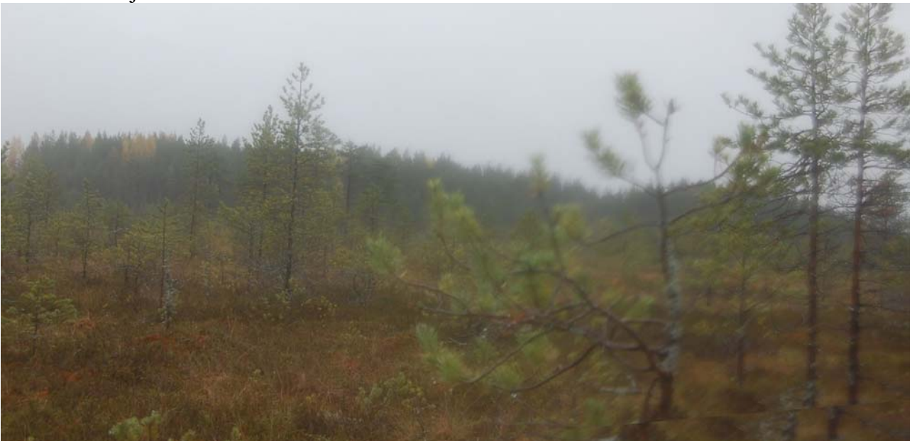
Kuva 8. Tällä suolla olin jo aika väsynyt. Näkyvyys suolla oli kuitenkin paljon laajempi kuin metsässä.

Aamuhämärissä kuuden seitsemän aikaan otin nopeasti kameran kainaloon ja saappaat jalkaani. Lähdin kuvaamaan auringonnousua noin kilometrin päässä olevan järven rantaan. Ajattelin käydä järven rannassa ja palata aamukahville ennen kuin muut heräisivät. Löysin järvelle vanhasta muistista ja otin muutaman kuvan heikosta auringon kajosta joka näkyi juuri ja juuri taivaan rannalla. Sitten alkoi sataa tihkua ja aurinkoa ei näkynyt enää koko päivänä. Eksyin tulomatalla tiheässä metsässä ja tulin isolle suolle. Muistelin talviretkiltä, että molemmin puolin mökkiä oli laajat suot.