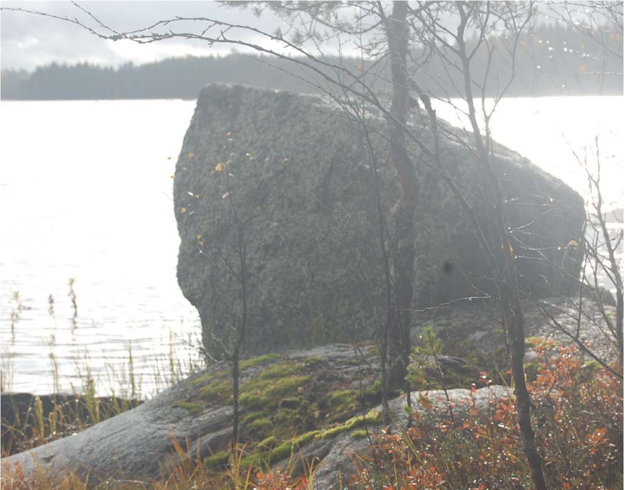
Kuva 10 Kaikki kivet näyttivät samanlaisilta kuin tämä aamuhämärissä otettu kuva. Järven nimi oli sopiva Suuri Kivijärvi.

Aluksi en ollut varma oliko tämä saman järvi missä olin ollut. Järvessä näkyi suuria kiviä. Olin aamulla ottanut kuvan tällaisesta suuresta kivistä. Kamera oli märkä vaikka olin koettanut suojella sitä puseron sisällä. Yritin katsoa kameran kuvia ja verrata niitä rannassa näkyviin kiviin. Se ei ollut helppoa. Kaikki kivet näyttivät samanlaisilta. Järven nimi on Suuri Kivijärvi. Nimi oli oikein annettu. Lähdin kulkemaan järven rantaa pitkin ja etsin tutun näköistä kohtaa.