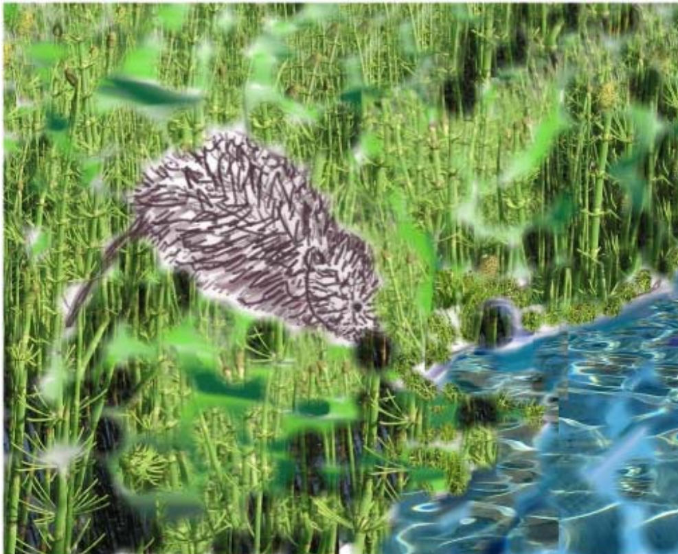
Kuva 11b Vesimyyrä

Erään ison kiven juuressa näin liikettä, Vesimyyrä katseli minua kiven kolossa. Kumpikaan ei ymmärtänyt pelätä. Otin rotasta muutaman kuva aivan läheltä. Matkalla putosin rantahetteeseen. Onneksi olin ottanut kepin avukseni ja pääsin sen avulla hyppäämään kelluvasta suonsilmäkkeestä