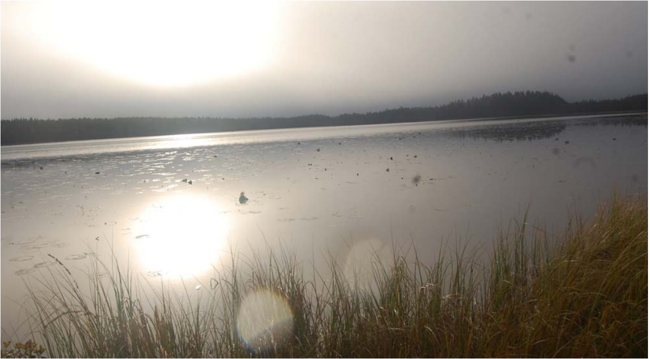
Kuva 7 Auringon nousun voi juuri ja juuri erottaa tästä kuvasta. Sumu muutti nopeasti sateeksi.