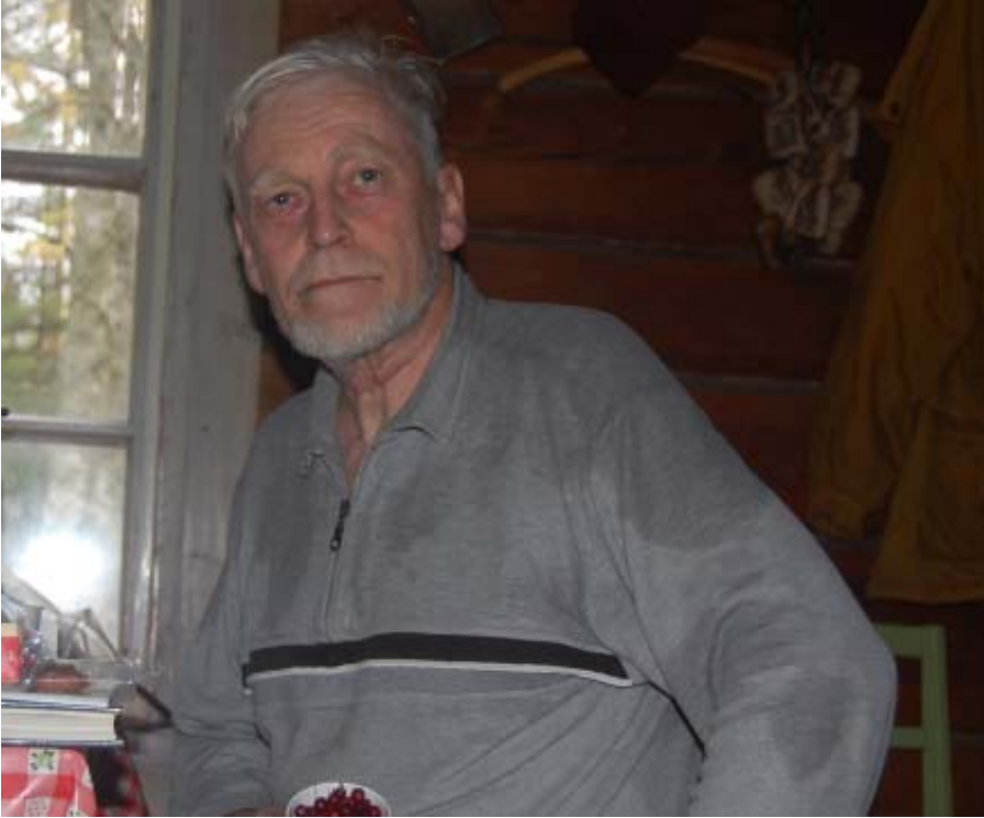
Kuva 13 Suolla kävelyn jälkeen olin märkä sisältä ja päältä. Marjoja jäi muillekin jakaa.