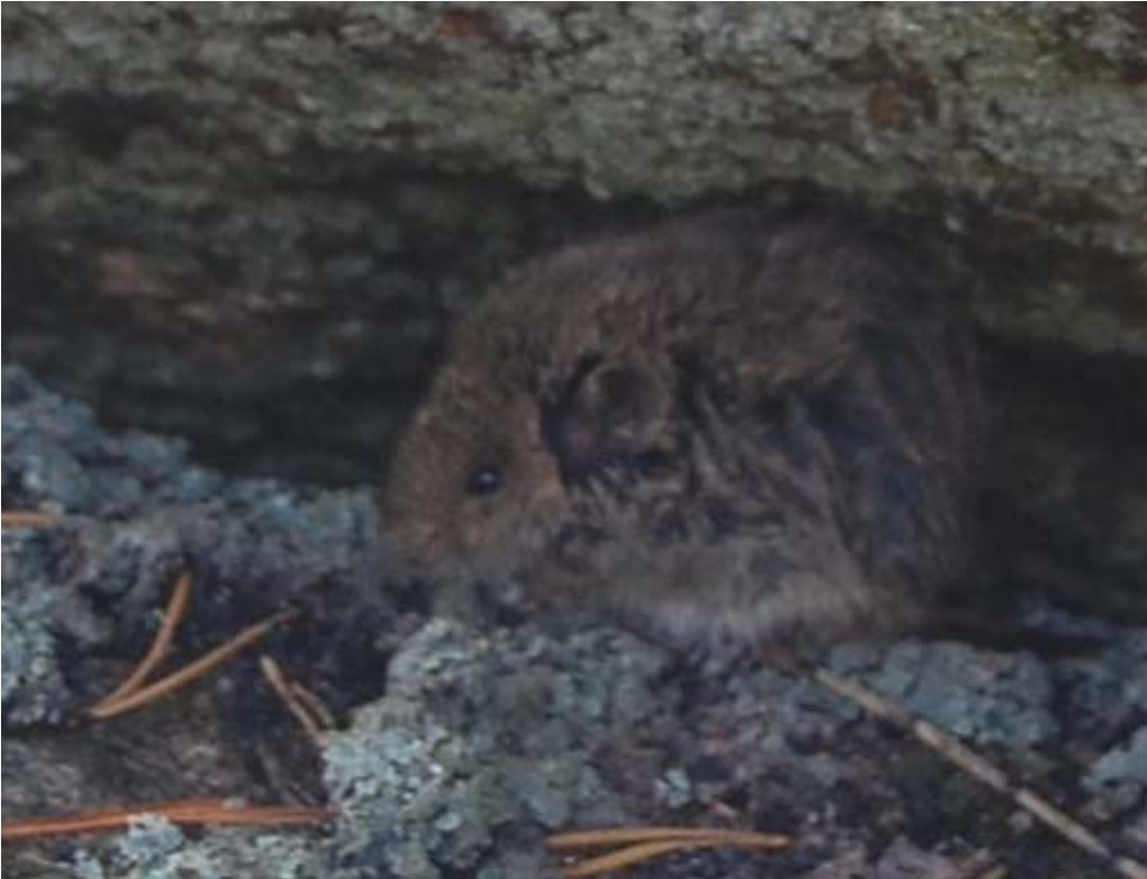
Kuva 11. Vesimyyrä