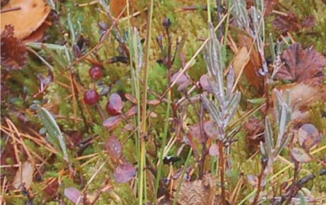
Kuva 9 Karpalot kasvavat järven rannan välittömässä läheisyydessä. Niitä piti noukkia taskuun evääksi koska muuta ruokaa ei ollut.

Toinen suo on ollut hiljattain järvi ainakin Eniron kartan mukaan. Karttoja ei tietysti minulla ollut mukana. Suon takana hämötti pieni metsäkumpare ja sen takana näytti olevan vaaleampi aukea. Ajattelin, että se voisi olla Seitsemisen tilan pelto. Muutaman tunnin kävelyn jälkeen tiesin, että sieltä avautuikin vain uusi, laaja suo. Tämä ei tuntunut oikealta suunnalta.